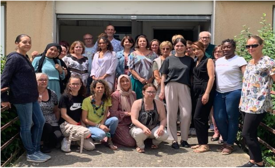
L'équipe d'Amidon 89 en juin 2022